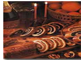
Mákos és Diós Beigli

d'une animation par les élèves du cours de langue hongroise et du tirage d'une tombola (bons de soutien à 2 € déjà disponibles au siège de l'Association).